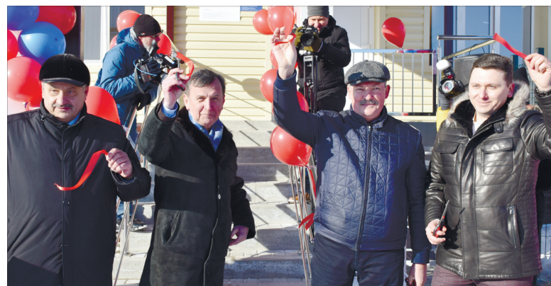
Торжественное открытие отделения диализа Выселковской ЦРБ.

На прошедшем совместном заседании профильных Коми-