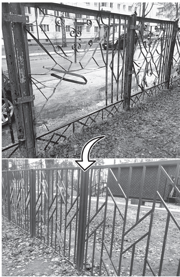
(Окончание. Начало на 4-й странице.)