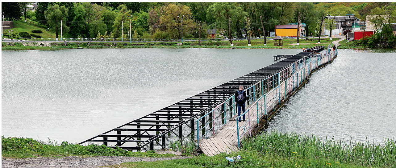
Понтонный мост построили 40 лет назад