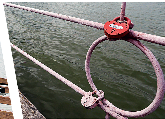
Замочки на счастье