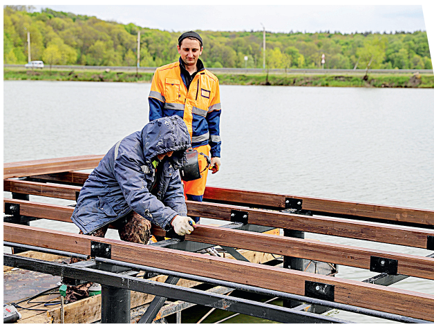
Строители обещают завершить работу к июлю