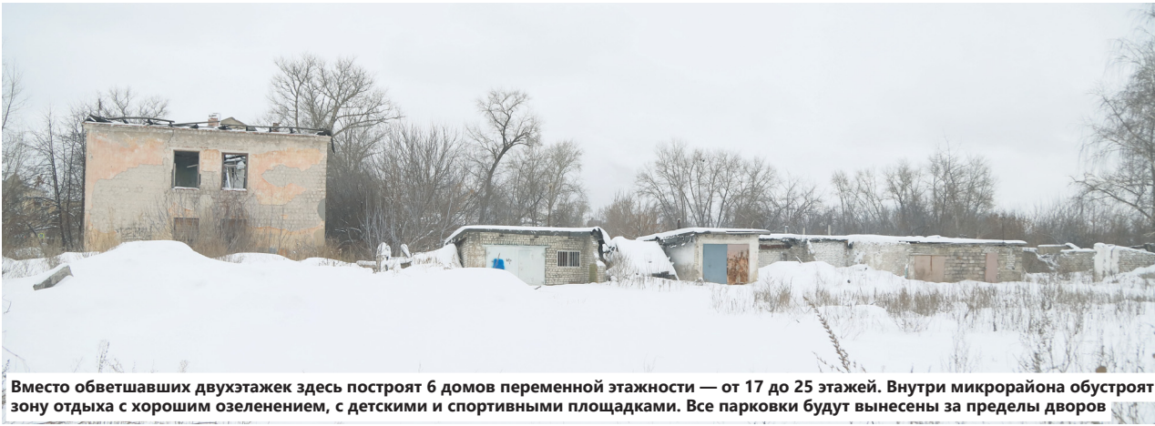
Вместо обветшавших двухэтажек здесь построят 6 домов переменной этажности — от 17 до 25 этажей. Внутри микрорайона обустроят зону отдыха с хорошим озеленением, с детскими и спортивными площадками. Все парковки будут вынесены за пределы дворов