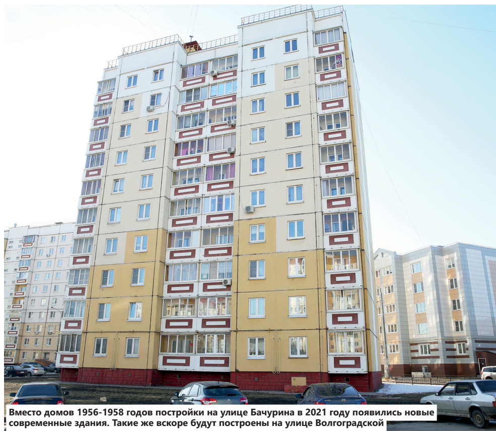
Вместо домов 1956-1958 годов постройки на улице Бачурина в 2021 году появились новые современные здания. Такие же вскоре будут построены на улице Волгоградской

Судьба ветхих зданий давно решена: их скоро снесут. На сегодняшний день