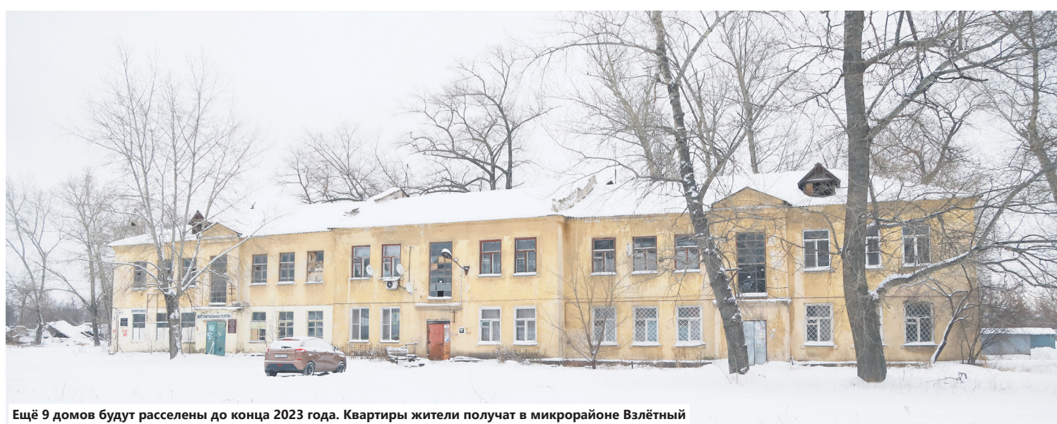
Ещё 9 домов будут расселены до конца 2023 года. Квартиры жители получат в микрорайоне Влётный

« В ПЛАНАХ ДЕПАРТАМЕНТА ОБНОВИТЬ ЕЩЁ НЕСКОЛЬКО ТЕРРИТОРИЙ В РАЙОНЕ ТРАКТОРНОГО — ОНИ НЕ ТАКИЕ МАСШТАБНЫЕ, ОДНАКО ТОЖЕ ТРЕБУЮТ ПРЕОБРАЗОВАНИЯ »