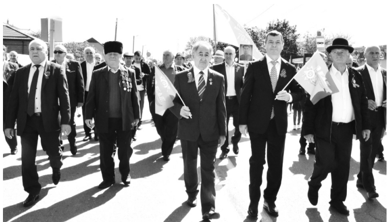
Шествие «Бессмертного полка», 2022 год