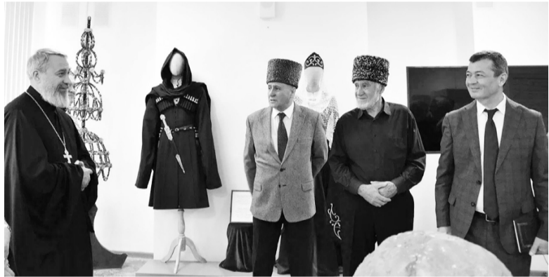
Делегация посетила обновленный после капитального ремонта городской краеведческий музей, 2022 год