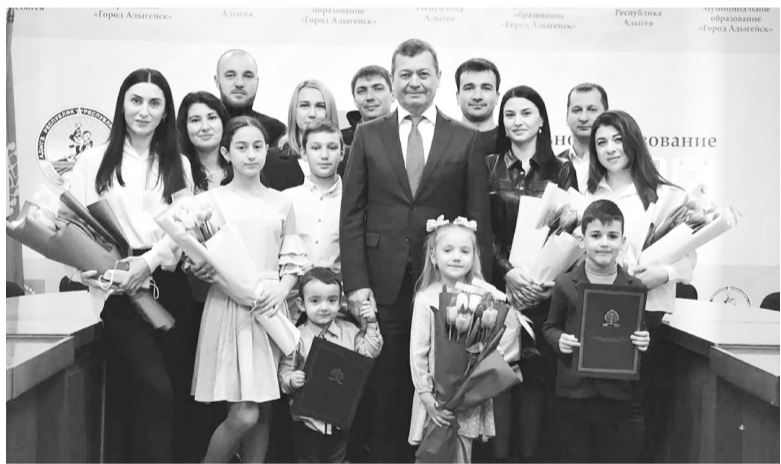
Вручение свидетельств о праве на получение социальной выплаты на приобретение жилья молодым семьям, 2022 год