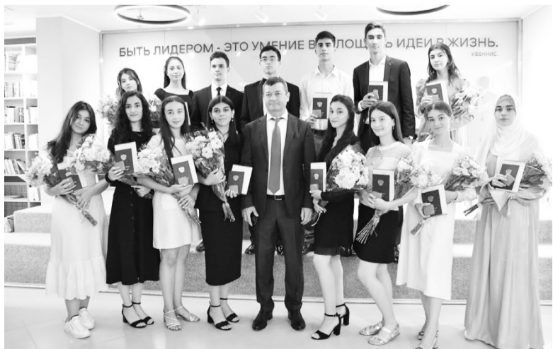
Встреча с обладателями медалей «За особые успехи в учебе», 2022 год