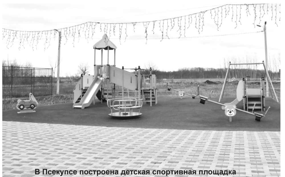
В Псекупсе построена детская спортивная площадка