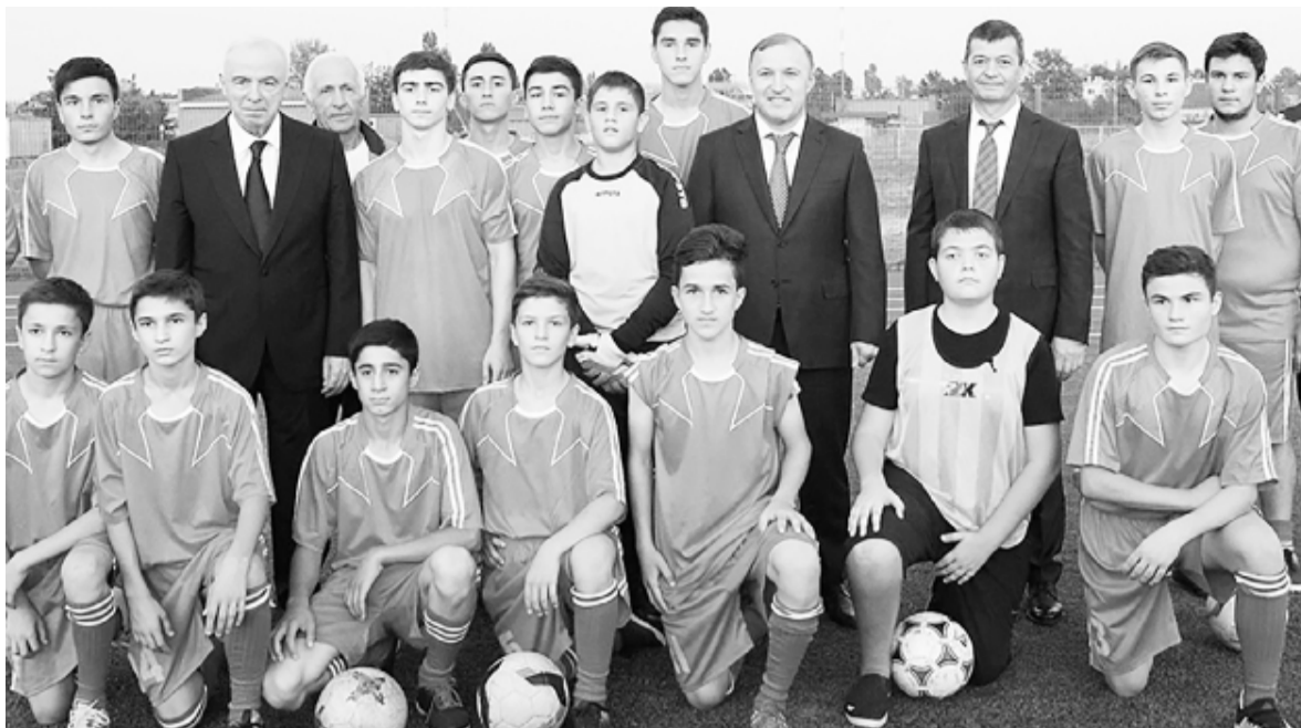
Одним из излюбленных мест приверженцев здорового образа жизни стала спортивная площадка на территории второй школы, построенная по соцпрограмме «Газпром – детям», 2019 год