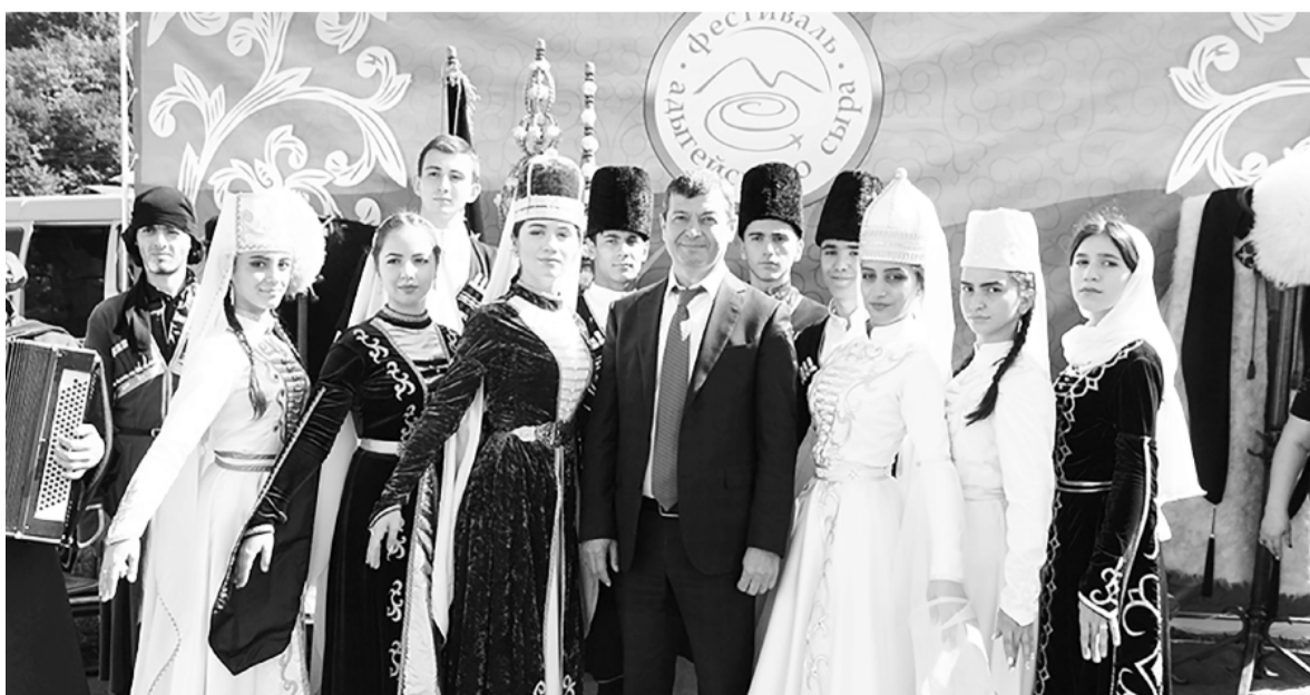
На фестивале адыгейского сыра, 2018 год