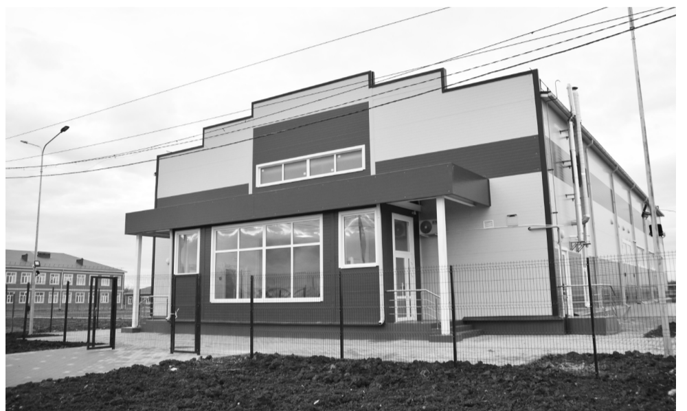
Физкультурно-оздоровительный комплекс в ауле Гатлукай