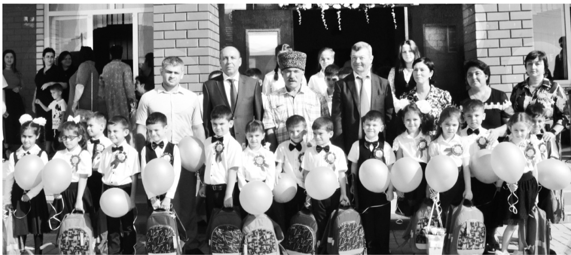
На торжественной линейке, посвященной Дню знаний. Гатлукай, 2022 год