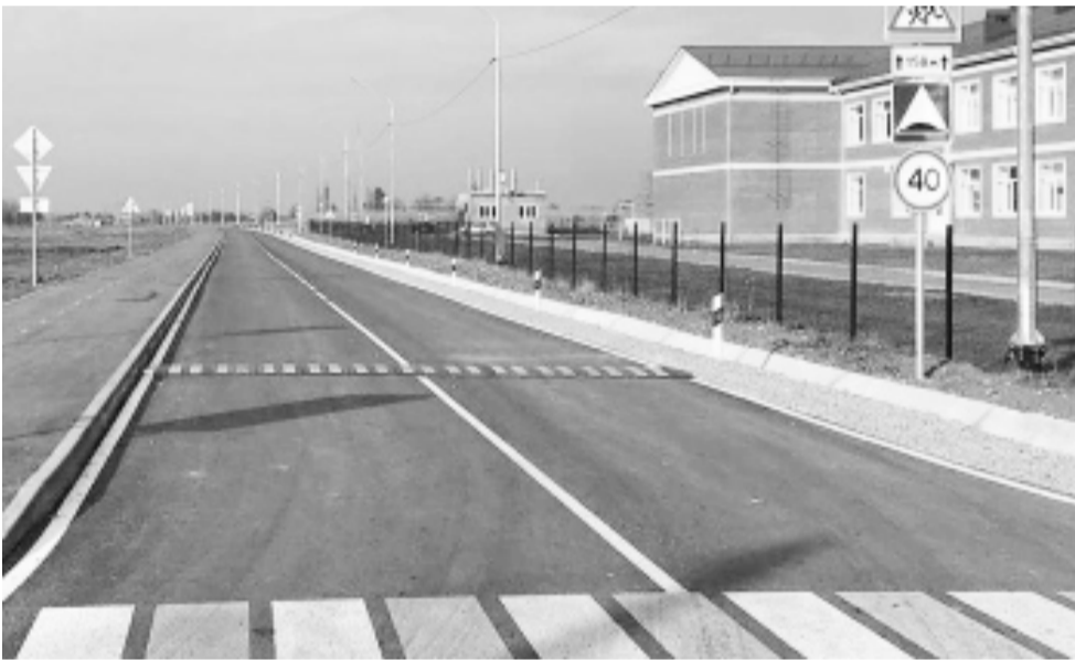
Строительство дороги по улице Цуга Теучежа в ауле Гатлукай. На этой же улице появилась детская игровая площадка