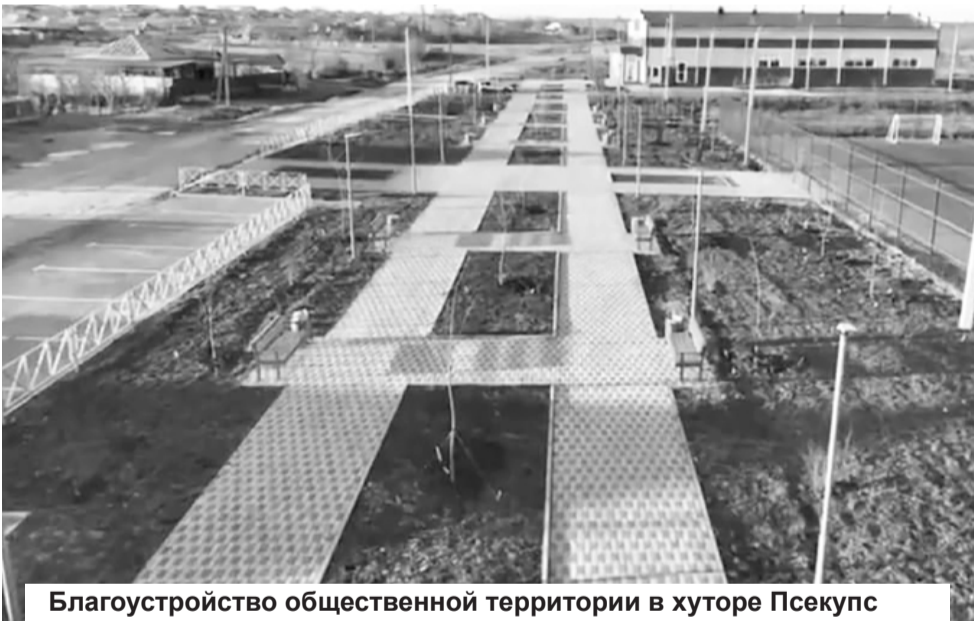
Благоустройство общественной территории в хуторе Псекупс