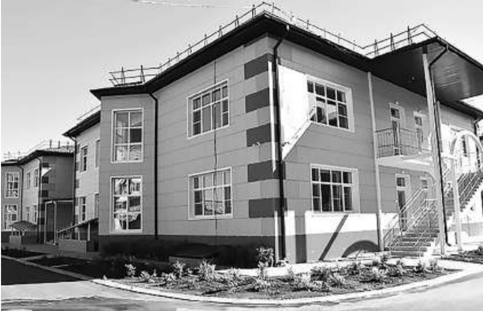
По нацпроекту «Демография» в 2020-м году завершено строительство двухэтажного детского сада на 240 мест