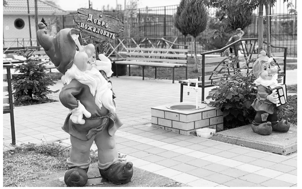
Благодаря жителям ближайших домов по улице Шовгенова благоустроена целая зона отдыха со спортивной и детской площадками